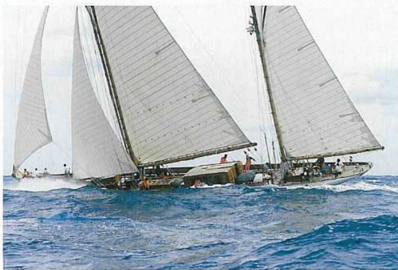
Jachty-weterani móż tu startujące łączą dzielność z pięknem

Kolejna impreza to Monaco Classic Week, nie mniej snobistyczna, ale także z elementami rywalizacji na wodzie. Tym razem