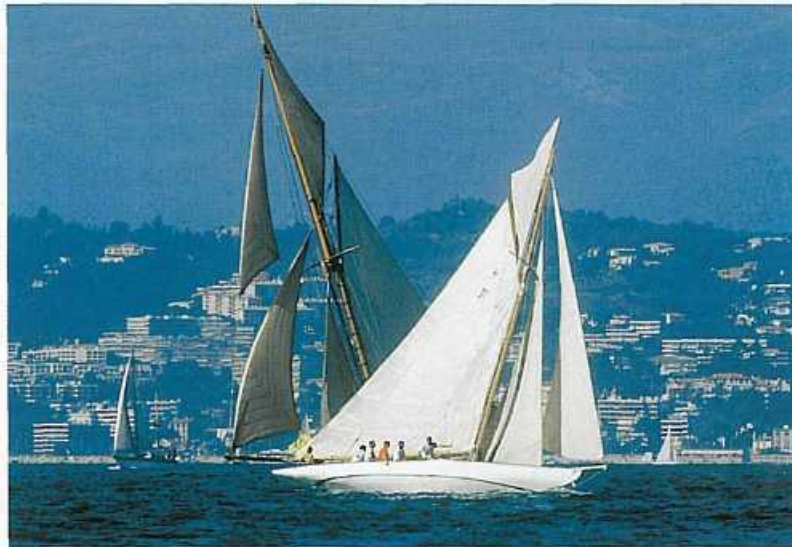
Startowały jachty z różnych krajów i epok

I wreszcie czwarta impreza to Les Voiles de Saint Tropez, impreza o charakterze bardziej towarzyskim, gdzie wypadało się pokazać i zaistnieć podczas imprez towarzyszących. Wręczenie nagród odbyło się w Cytadeli podczas wspaniałej uroczystości zorganizowanej dla wszystkich uczestników. Czy takie regaty mają szansę przetrwania?