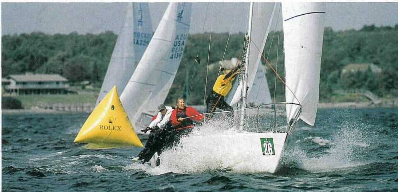
Walka na boi

gatami, więc brak zgrania rzutowała na ich poczynania.