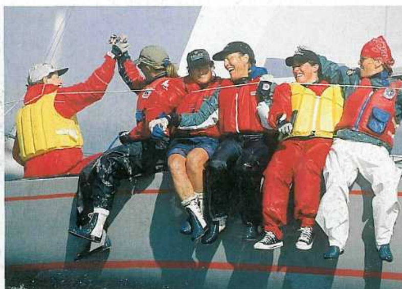
Po zwycięskim biegu

długość całkowita 7,3 m szerokość 2,7 m powierzchnia żagli .. 24,2 m 2