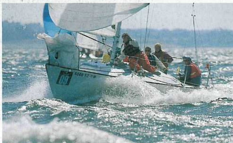
W pierwszych dniach regat wiało niezle...