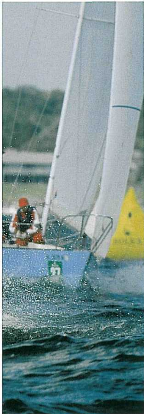
Na trasie regat.

M istrzostwa Świata Kobiet rozgrywane są co dwa lata na wodach okalających Newport - Mekkę amerykańskiego żeglarstwa. Od lat imprezie patronuje firma Rolex, nic zatem dziwnego, że potrafią uporać się z problemem frekwencji i udziału gwiazd kobiecego żeglarstwa. Pierwsze regaty rozegrano w 1985 roku. Zazwyczaj startuje od 35 do 45 jachtów. Nie są to może regaty szczególnie popularne wśród żeglarek europejskich, ale na starcie stawały już liczące się zawodniczki. Ogółem startowały ekipy z 17 krajów.