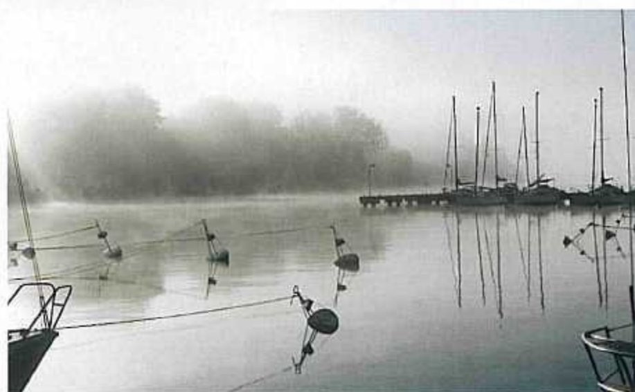
„Poranek w Trzebieży”