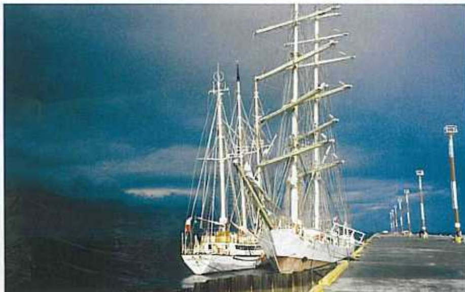
„ZAWISZA i CHOPIN w porcie Ushuaia”

5. Najlepsze prace zostaną nagrodzone. Rozstrzygnięcie konkursu nastąpi w grudniu 2000 roku.