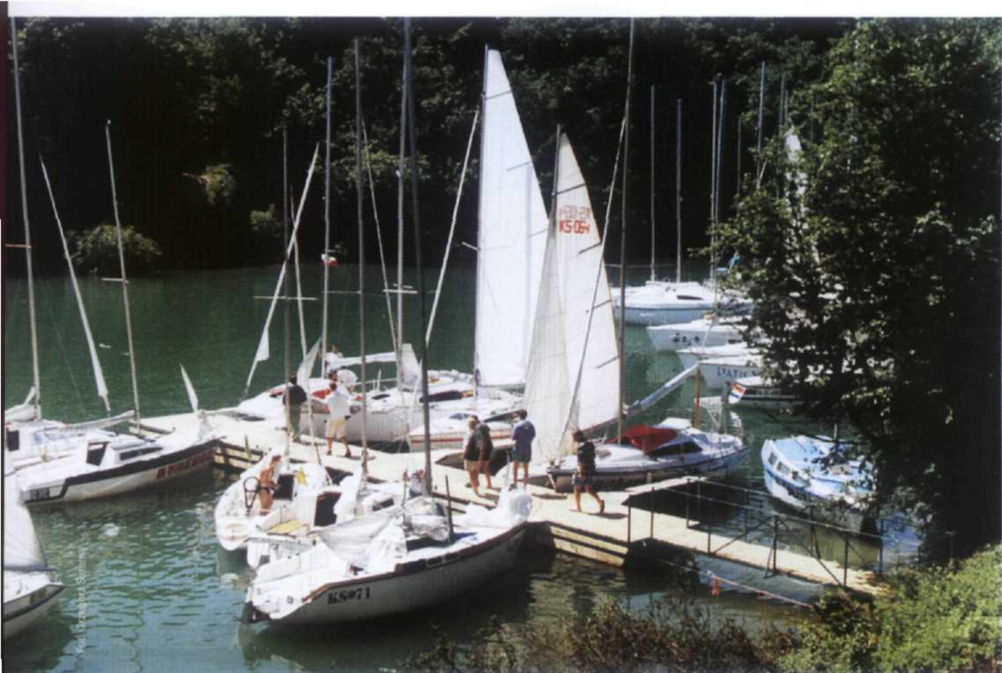
Port jacht klubu Naftowiec

dząc do Rajskiego, a jej odgałęzienie dochodzi do Chrewtu, wchodząc w dolinę potoku Czarnego.