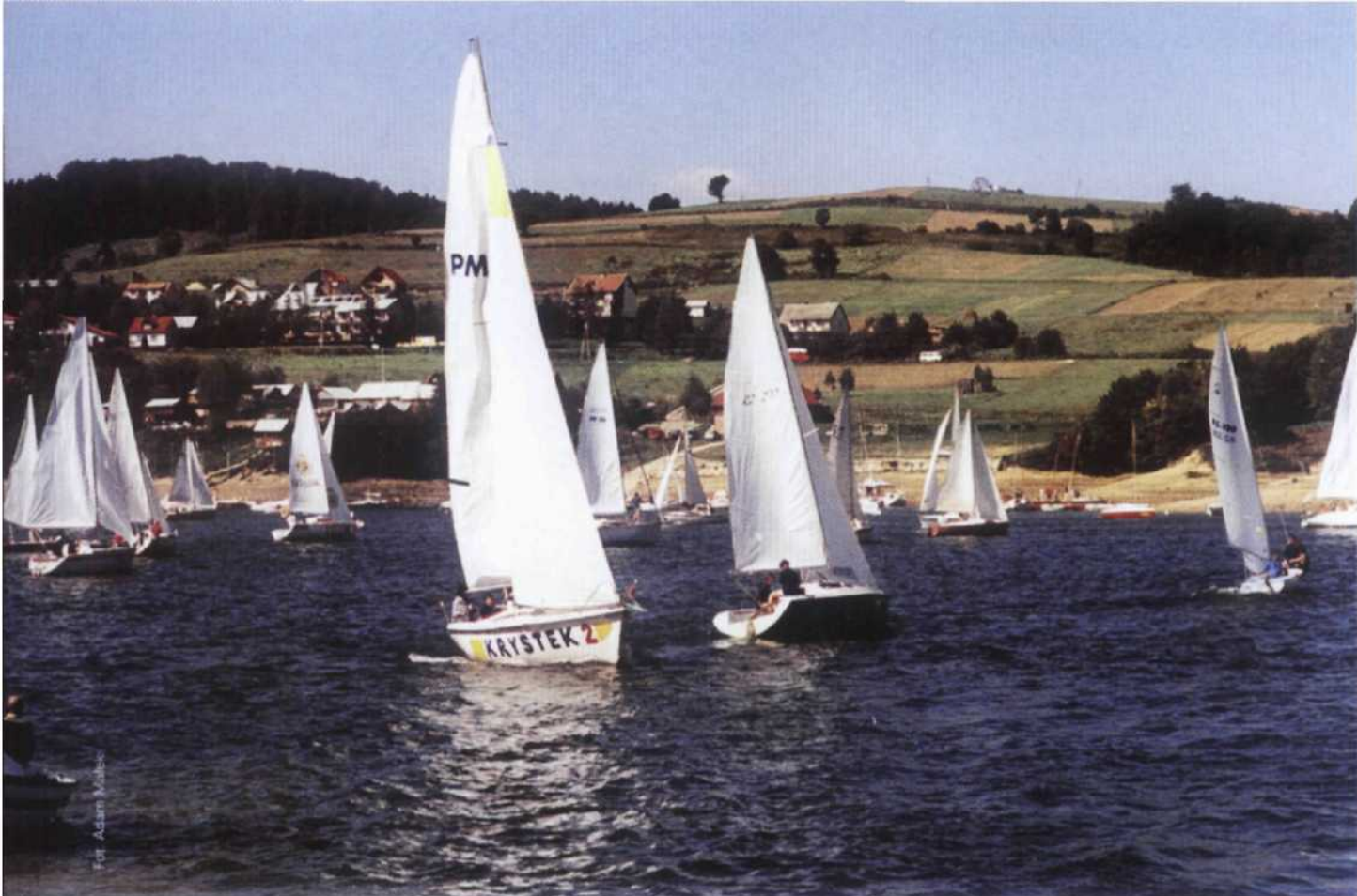
Regaty - start przy wyspie Energetyka

• Żeglarski Ośrodek Szkoleniowo Wypoczynkowy „Energetyka” , tel. 090/345 174.