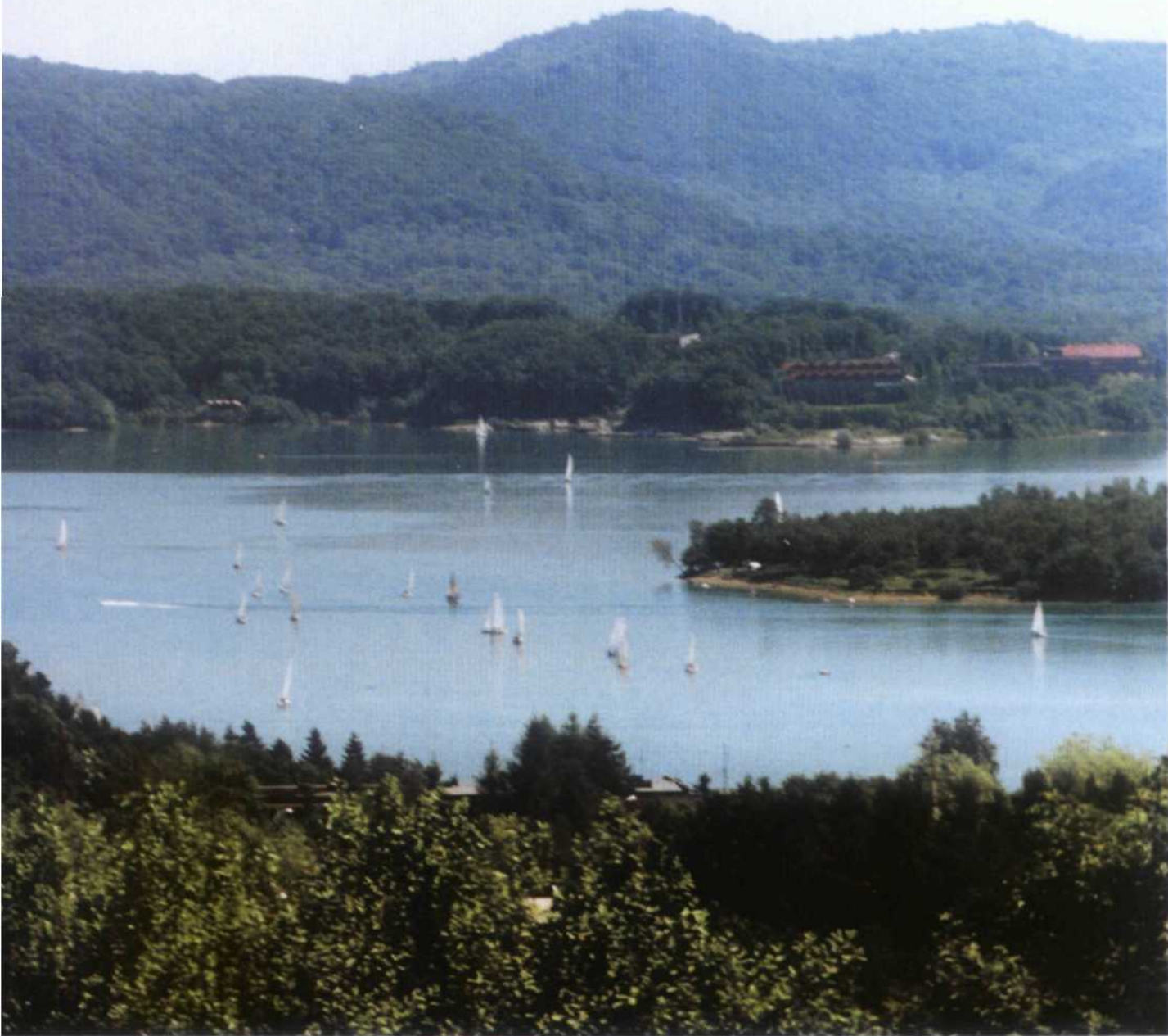
Widok na „Bieszczadzkie morze” od strony Polańczyka

Bezpośrednio nad jeziorem znajdują się wzniesienia, z których najwyższe od strony zachodniej są Wierchy (635 m n.p.m.); od południa - Tołsta (749 m n.p.m.) i pasmo Otrytu (820 m n.p.m.); od wschodu zaś najwyższy jest Jawor (741 m n.p.m.). Jezioro swymi licznymi zatokami malowniczo wrzyna się niczym fiordami, pomiędzy stoki otaczających je gór. Dzięki temu szlaki wodne jeziora są bardzo atrakcyjne, a urozmaicona linia