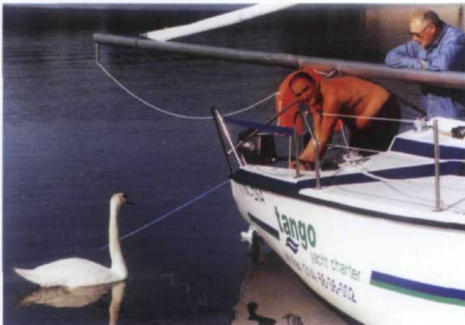
Wakacje na wodzie może nie są najtańsze, ale na pewno są wspaniałe

Nowym pomysłem na akwenie Wielkich Jezior Mazurskich są tzw. czartery wahadłowe. Czarterobiorca odbiera jacht np. w okolicach Węgorzewa, a oddaje gdzieś na południu Mazur. Pozwala to opłynąć cały akwen WJM bez konieczności powrotu w miejsce startu. Ma to także te zalety, że mamy więcej czasu i po drodze możemy zwiedzić boczne, rzadziej odwiedzane, a bardzo ciekawe i malownicze szlaki.