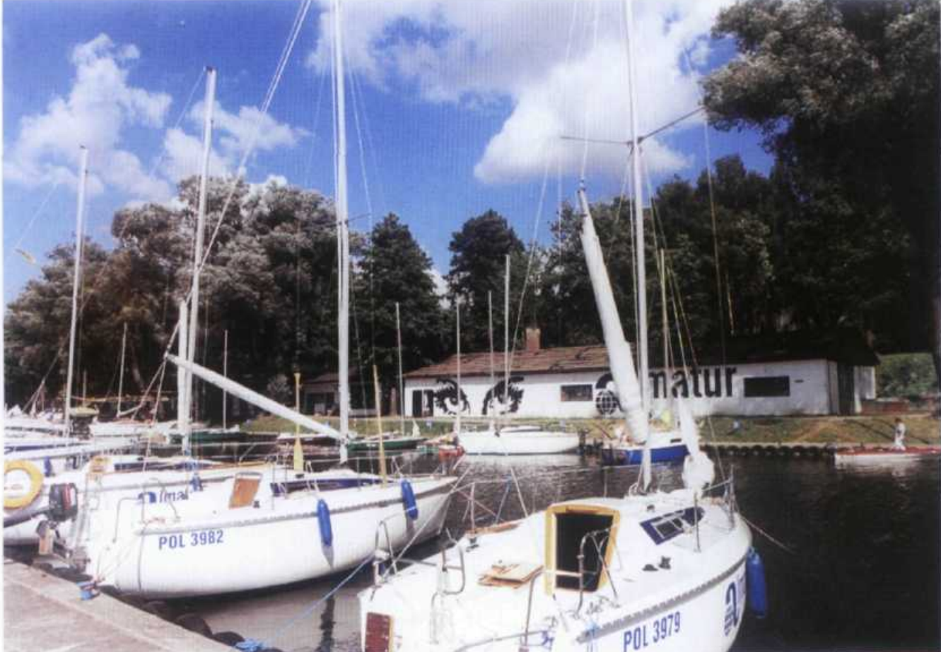
Konkurencja między firmami czarterowymi na Mazurach jest coraz większa, co oczywiście jest korzystne dla "czarterobiorców"