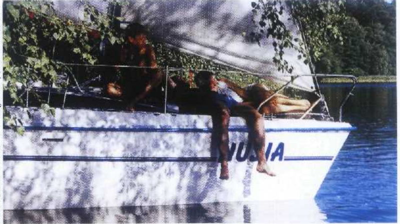
Praca niedokonana na konkurs fotograficzny

1) wręgi, 2) odmiana ożaglowania gaflowego, 3) port u ujścia Słupi, 4)... VII - żeglowała na nim Marie Fauroux w regatach OSTAR '72, 5) holownicza lub radarowa, 6) rezerwa, 7) członek szkolnej załogi żaglowego statku szkolnego, 8) nie mundurowy, 9) części, odcinki rejsu, 15) komenda przeciwna do „wybieraj!” 16) przednia część kadłuba, 17) 100 centów, 19) największa z Małych Wysp Sundajskich, 20) na wyposażeniu śmigłowców ratowniczych, 21) żywica kanarecznika, spoiwo wyrobów lakierowych, 24) stosowany przy balastowaniu,