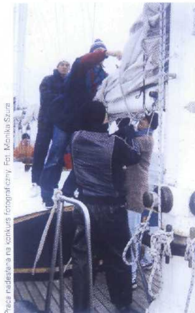
Prace nadleśnika na konkurs fotograficzny.

skiego, 7) wśród żagli refowych, 8) wieś w Puszczy Kampinoskiej, 14) toaleta jachtowa, 15) ferholung, 18) nazwa kolejnych 3 jachtów, na których wiatcach 1932-39 Władysław Wagner odbył rejs dookoła świata, 19) lina stalowa występująca w olinowaniu ruchomym dużych żaglowców, 21)... abrazyjna to podcios brzegowy powstający w dolnej części żywego klifu, 24) atak z własnym kalem, 25) dodanie żagli refowych na żaglowcach o ozaglowaniu suchym, 27) zmywacz pokładowy, 28) żagiel sztormowy stawiany zamiast grota, 31) rodzaj rufy, 32) dokument lub cecha legalizacyjna, np. metryka Polskiego Rejestru Statków, 33) oszczep rzymskiego legionisty.