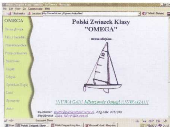
Strona Polskiego Związku Klasy Omega