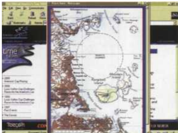
Mapka akwenu, w którym odbędą się regaty America's Cup 2000

To jedna z wielu stron podających na bieżąco informacje z przygotowań do America's Cup 2000. Strona aktualizowana jest co najmniej raz na miesiąc. Znaleźć można na niej listę startujących w regatach ekip wraz z najnowszymi szczegółami technicznymi jachtów i poczynaniami ich załóg, a także pełnymi danymi adresowymi i oczywiście odnośnikami do ich internetowych stron. Interesujący jest