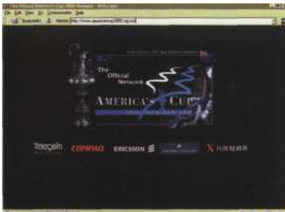
Oficjalna strona regat America's Cup 2000

Ofcwiście taka strona nie może obejść się bez po- ważnej galerii zdjęć regat z pokładów jachtów, ładu i po-