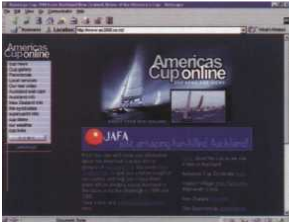
Serwis nowozelandzki Americas Cup online

wietrzą - najważniejsze jest przy tym oczywiście, aby uchwycić odpowiedni moment ukazujący walkę o każdy ułamek węzła. Obok galerii znajdziecie tutaj stronę promującą Auckland i Nową Zelandię - krajobrazy, mapy, przewodniki po hotelach, restauracjach, muzeach i miejscach, które warto obejrzeć, a także obowiązkowo prognozę pogody. Autorzy podają również adresy najbardziej przydatnych instytucji w Auckland - firm reperujących jachty, wypożyczających samochody, motorówki, agencji ochrony, dostawców Internetu i wielu innych. Wszystko to uzupełniam aktualizowany co kilka minut widok z kamery zainstalowanej w Auckland. Dalsza część traktuje już tylko o regatach - jest tu obowiązkowa lista ekip z linkami do ich stron internetowych, kalendarium wyścigów i prognoza pogody ze zdjęciami satelitarnymi.