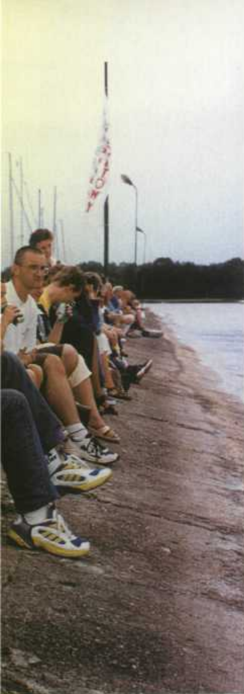
Free-stylowcy trzymali widzów w napięciu