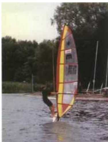
Ekwilibrystyka deskarska - jazda „na sztorc”