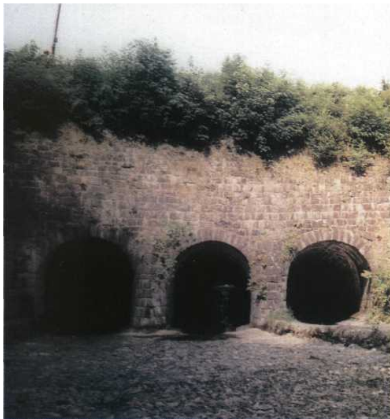
Tunele pod kanałem pozwalają na przejście pod dnem

Podczas gdy cała armada uczestnicząca w operacji Cutty Sark Tall Ships Races '98 odpłynęła do Portsmouth, nasz TORNADO odłożył się na kurs północny-w kierunku Belfastu i Glasgow Silny, przeciwny wiatr (NNW) i krótka, prawie bałtycka fala, która powitała nas zaraz za wyspą Man, nie nastrajały optymistycznie. Po 30 godzinach żeglugi osiągnęliśmy skaliste brzegi North Channel. Byliśmy na początku kanału Kaledońskiego.