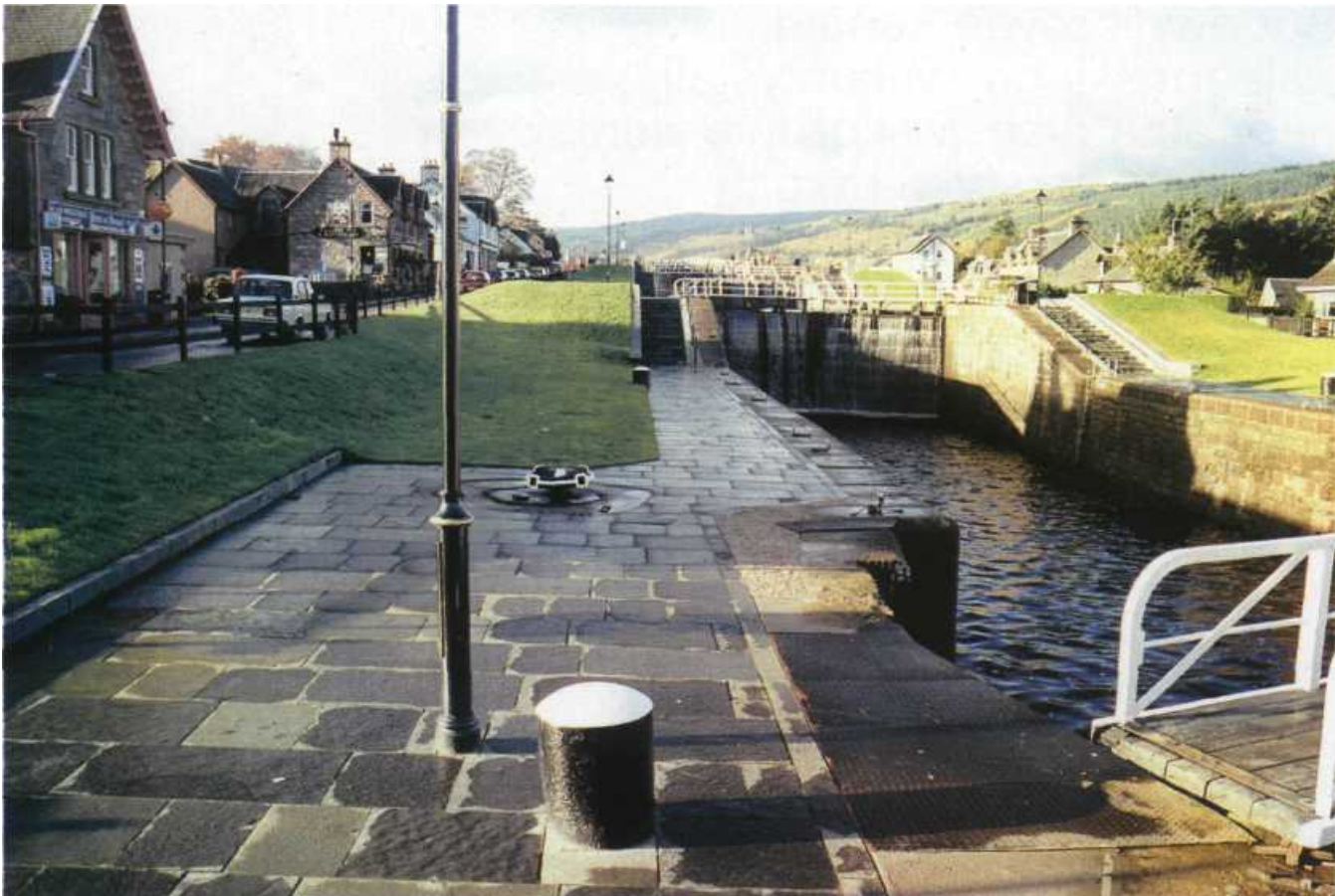
Jedna z systemu siedmiu śluz w Fort Augustus