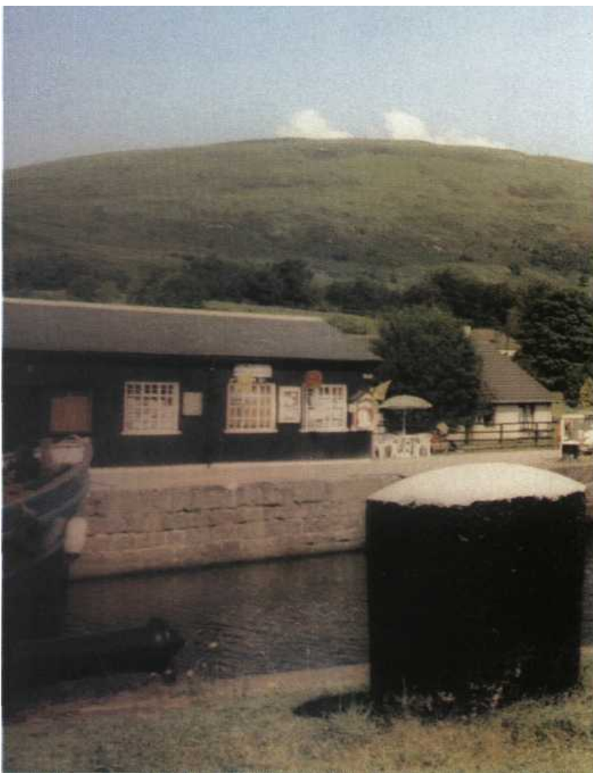
Nigdy gospodarcze znaczenie Kanału nie było sprawą pierwszoplanową

Do podejścia i przejścia kanału niezbędne są niektóre specjalne mapy: East Approaches 1078; Inverness Firth & Cromarty Firth 1077; Canal 1791; Caledonian Canal West Approaches 2380 wraz ze szczegółem podejścia do Corpach 2372; Loch Linnhe Northern and Central 2379.