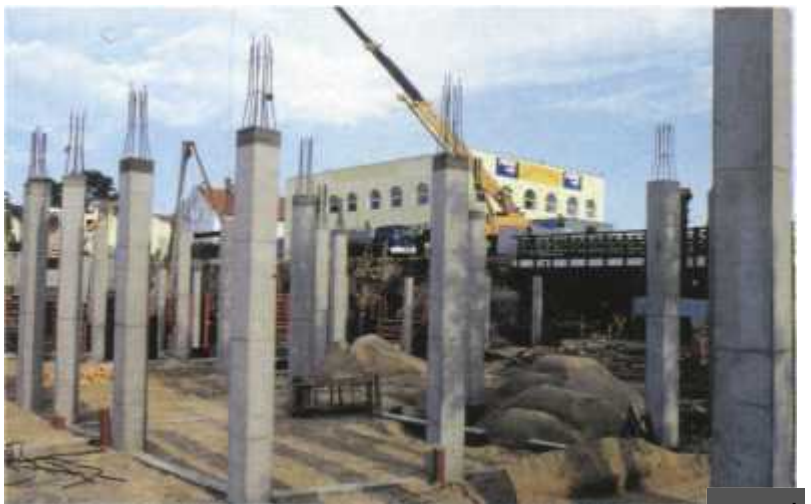
Rośnie apartamentowiec Bulwar