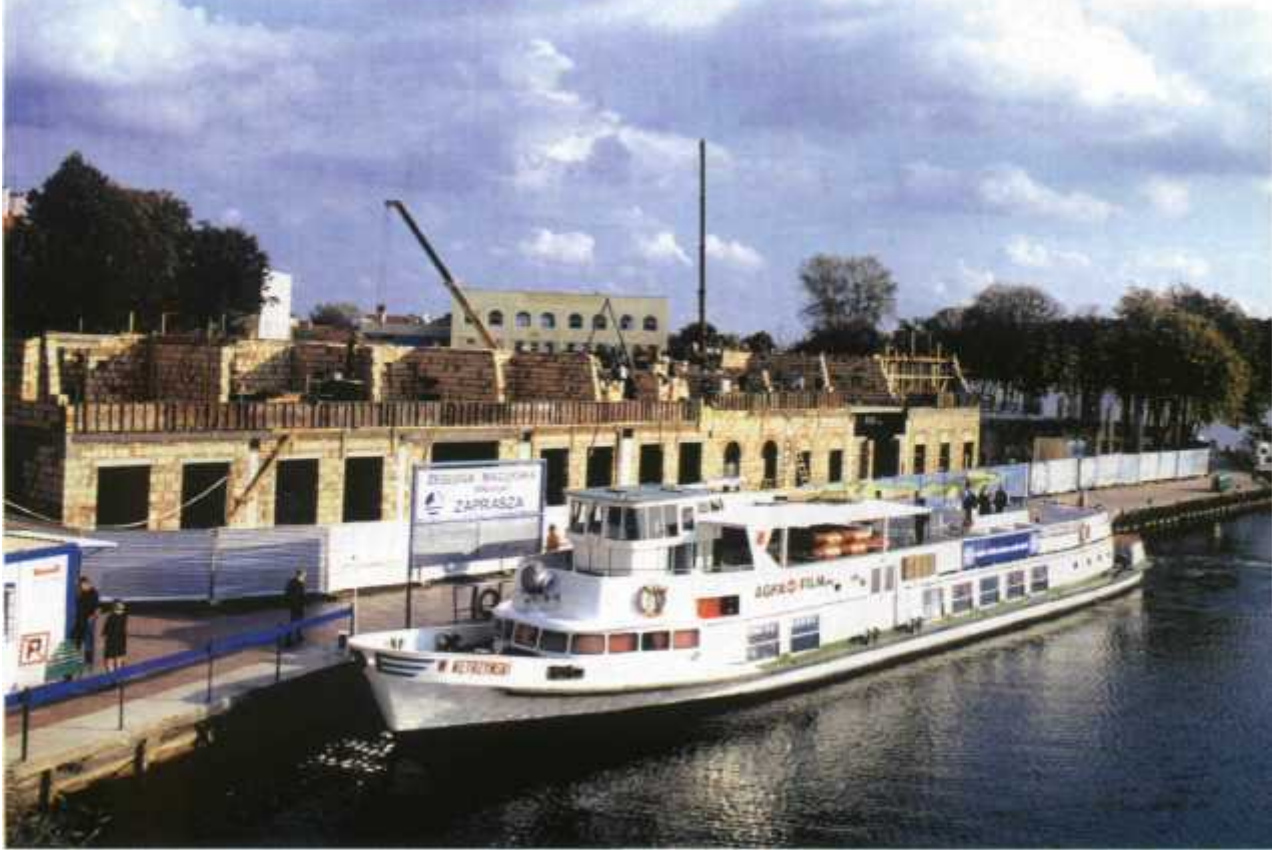
Zaawansowane prace przy kompleksie Sielawa