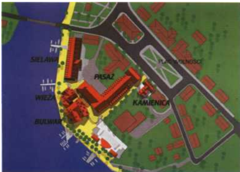
Rozmieszczenie apartamentów na Przyryнку. Już niedługo będzie się można do nich wprowadzić

Największe jednak zainteresowanie wzbudzają mieszkania pod wynajem z ulgą budowlaną, zlokalizowane w budynku Sielawy.