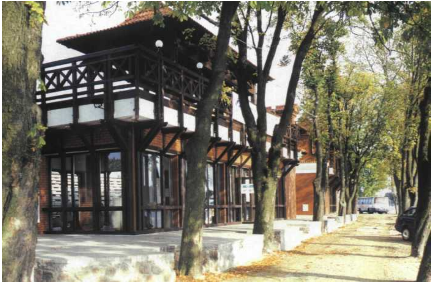
Mikołajska siedziba Inter Commerce - nowoczesna architektonicznie i wkomponowana w otoczenie