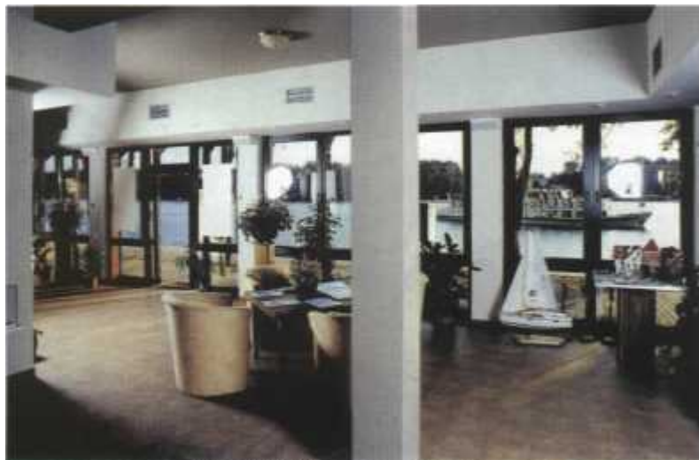
Widok z okien biura - wprost na jezioro