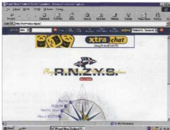
Wizytówka strony nowozelandzkiej

• Bardzo przyjemna jest wycieczka do Nowej Zelandii, do Royal New Zealand Yachting Squadron