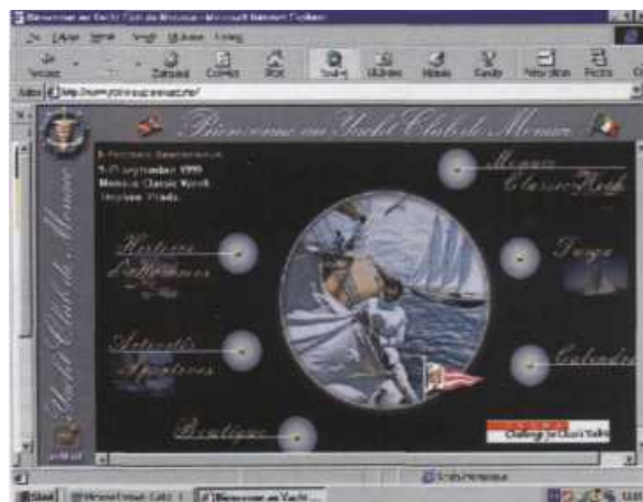
Ładna dwujęzyczna strona klubu z Monako

• Za to Yacht Club Monaco ( www.yacht-club-monaco.mc ) prezentuje naprawdę profesjonalnie przygotowaną i prowadzoną stronę w dwóch językach: po