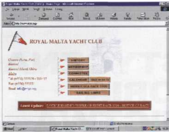
Oszczędnie i rzeczowo - Królewski Klub Maltański

Malta to wyspa raczej rzeczywistych niż wirtualnych navigatorów.