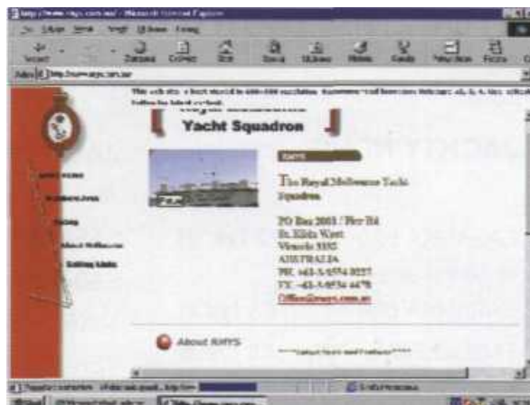
Królewski szwadron żeglarski z Melbourne

• Z kolei Royal Melbourne Yachting Squadron ( www.rmys.com.au ) to strona klubu z Port Phillip Bay,