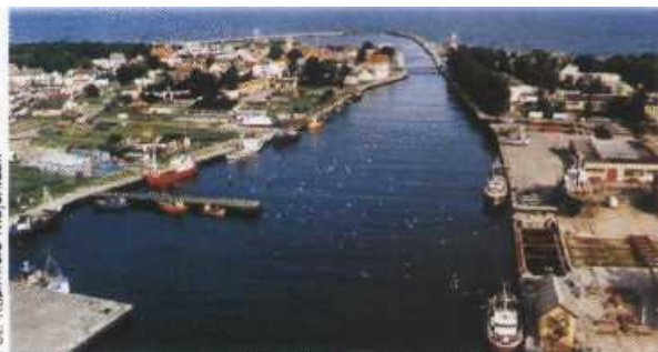
Fot. Kazimierz Majchrzak