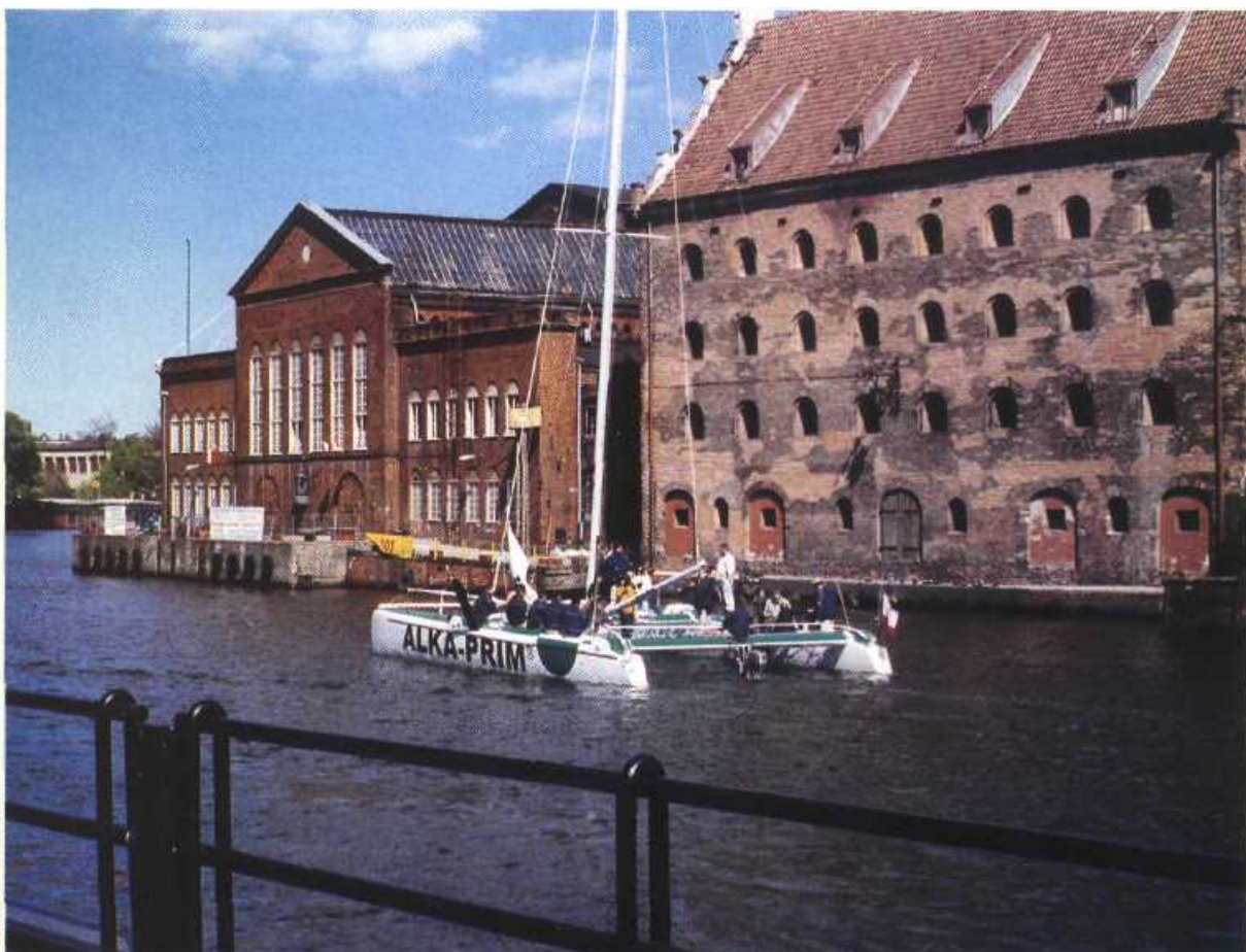
Fot. Marcin Malinowski